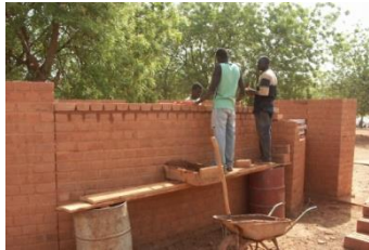
Die Kinder tragen Steine zum Bau; die Männer aus dem Dorf mauern; die Frauen stampfen auf traditionelle Weise den Boden.