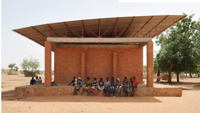
Unten: das erste Schulgebäude

Um den großen Zulauf zu bewältigen, ist 2009 ein zweites Schulhaus entstanden.