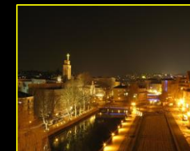
Pforzheim bei Nacht