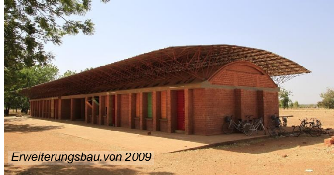
Erweiterungsbau von 2009

Um den großen Zulauf zu bewältigen, ist 2009 ein zweites Schulhaus entstanden.