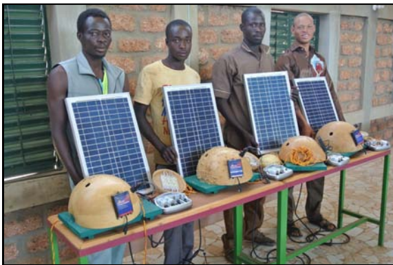
Teilnehmer eines SHS-Baukurses mit ihren selbst gefertigten Solaranlagen

Die 130 Solarlampen, die ich im März 2014 ursprünglich für Gando bestellt hatte, habe ich an Robert und an meinen Freund Pascal Naré in Koupéla geliefert. Sie werden versuchen, die Lampen zu verkaufen, um damit einen Teil des Geldes für einen nächsten Baukurs in Pascals Dorf zusammen zu bekommen. Auch Sie können mit Ihrer Spende dazu beitragen, dass dieser und weitere Baukurse stattfinden!