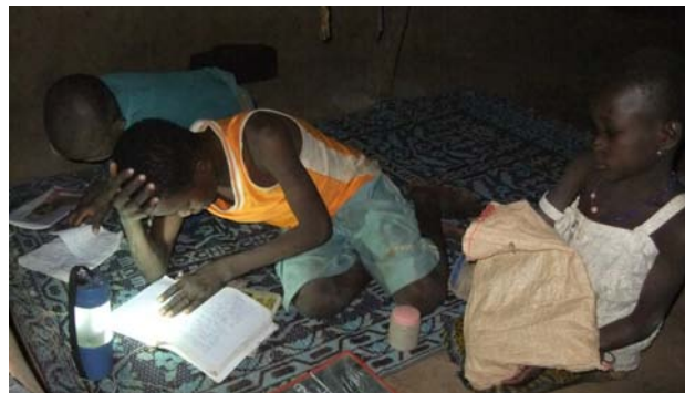
Seit 2012: Solarlampen ermöglichen es den Kindern in Gando nach Anbruch der Dunkelheit zu lernen— aber wer wartet die Lampen jetzt??

Ich möchte mein Projekt unter dem Namen „Licht für Gando“ weiterlaufen lassen in der Hoffnung, unsere Arbeit in Gando irgendwann