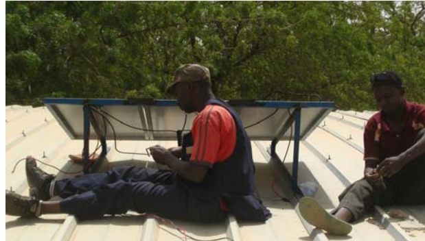
2012: Installation einer PV-Anlage auf der Grundschule in Gando—aber wer wartet sie jetzt??

Projekte parallel zu den eher visionären Bauprojekten von Herrn Kéré weiterzuführen. Herr Kéré blockiert dies.